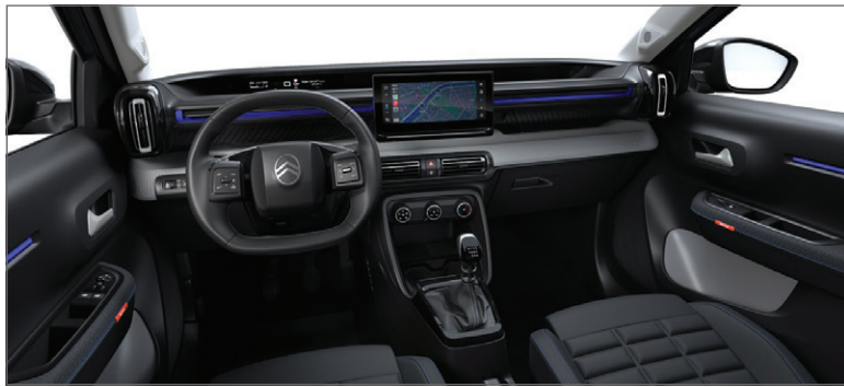
PLUS: LÁTKA ČERNÁ FABRIC / ŠEDÁ SERGE FABRIC