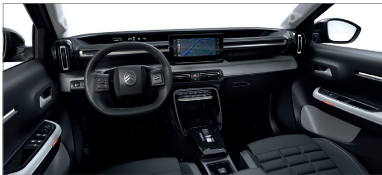
MAX: LÁTKA ČERNÁ FABRIC / ŠEDÁ KOŽENKA