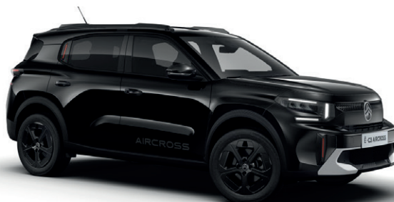
Černá PERLA NERA (M)