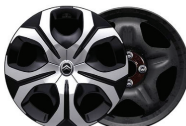
Okrasný kryt SYLVANITE 17"