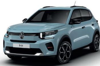
Modrá MONTE CARLO