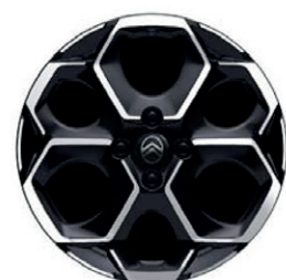
Hliníkový disk ATACAMITE 17" s výbrusem