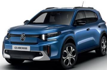
Modrá BRIGHT (M)