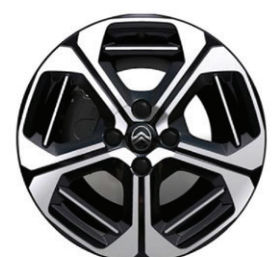
Hliníkový disk ARAGONITE 17" – s výbrusem