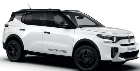
Bílá BANQUISE (N)