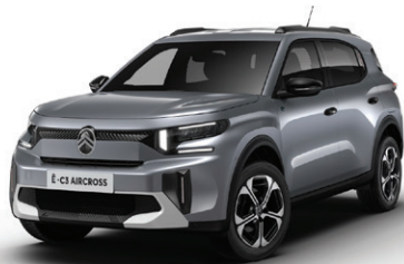
Šedá MERCURY (M)