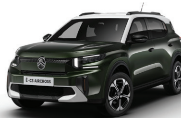
Zelená MONTANA (M)