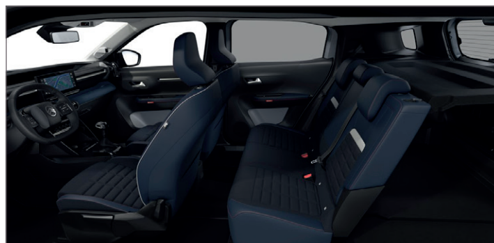
SEDADLA ADVANCED COMFORT®