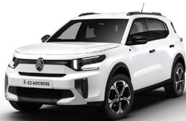
Bílá BANQUISE (N)