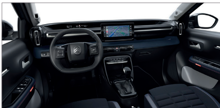
COLLECTION: MIX LÁTKA HELLO ČERNÁ TEP / LÁTKA MODRÁ TEP