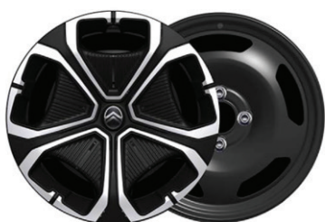
Okrasný kryt TITANITE 16"