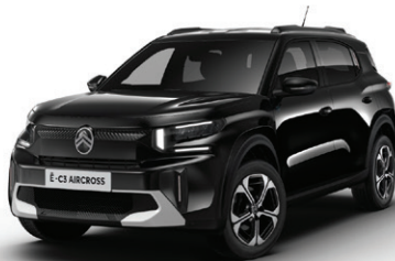
Černá PERLA NERA (M)