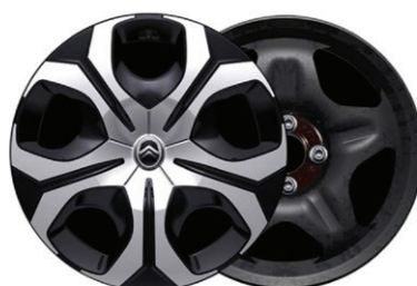
Okrasný kryt SYLVANITE 17"