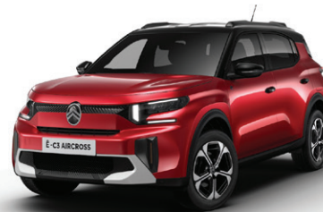
Červená ELIXIR (M)