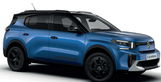
Modrá BRIGHT (M)