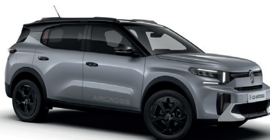
Šedá MERCURY (M)