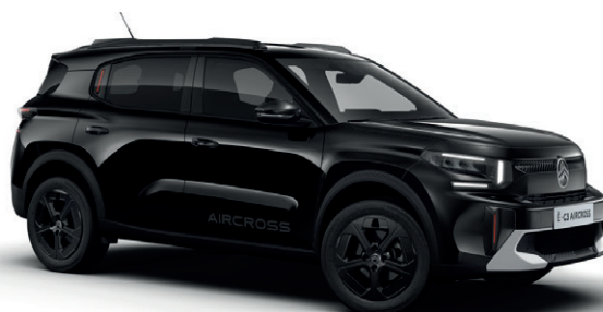
Černá PERLA NERA (M)