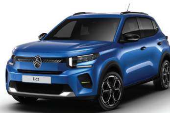
Modrá BRIGHT (M)