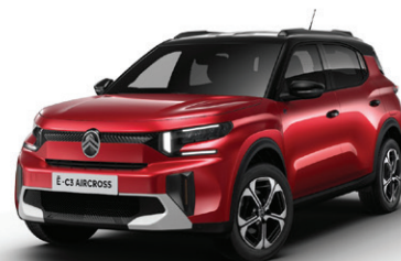
Červená ELIXIR (M)