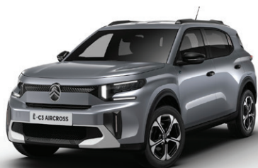
Šedá MERCURY (M)