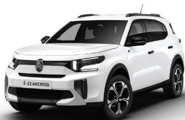
Bílá BANQUISE (N)