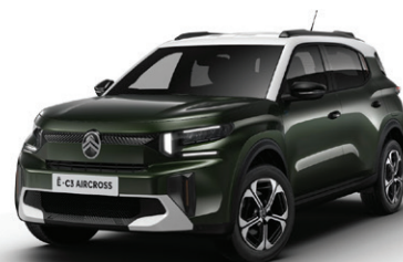
Zelená MONTANA (M)