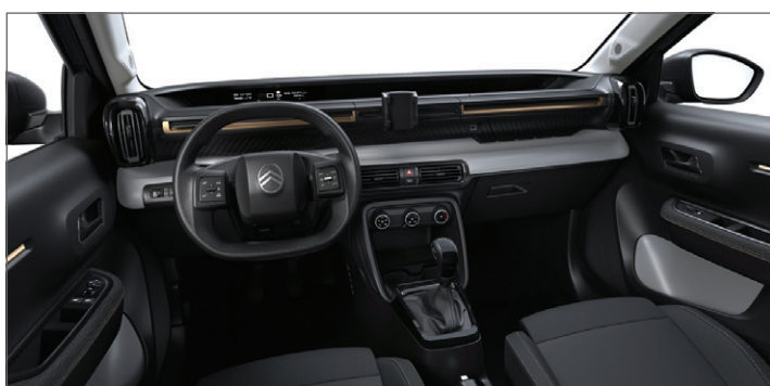
YOU: LÁTKA ČERNÁ / LÁTKA QUADRIC