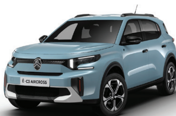
Modrá MONTE CARLO (N)