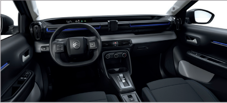
YOU: LÁTKA ČERNÁ FABRIC / ŠEDÁ FABRIC