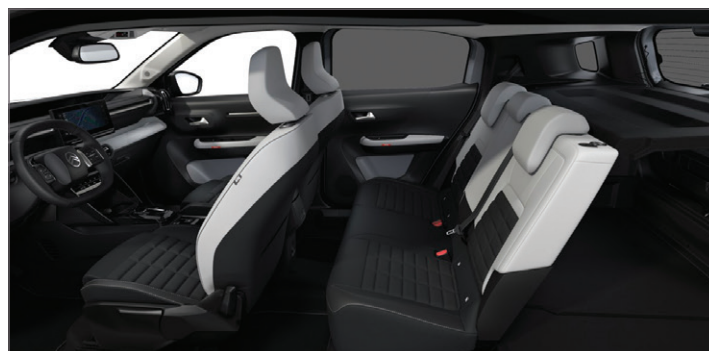
SEDADLA ADVANCED COMFORT®