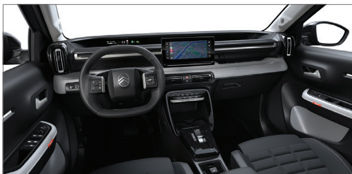
MAX: LÁTKA ČERNÁ HELLO / SVĚTLÉ ŠEDÁ KOŽENKA