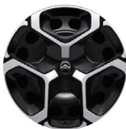
Okrasný kryt AZURITE 17"