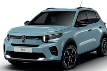
Modrá MONTE CARLO