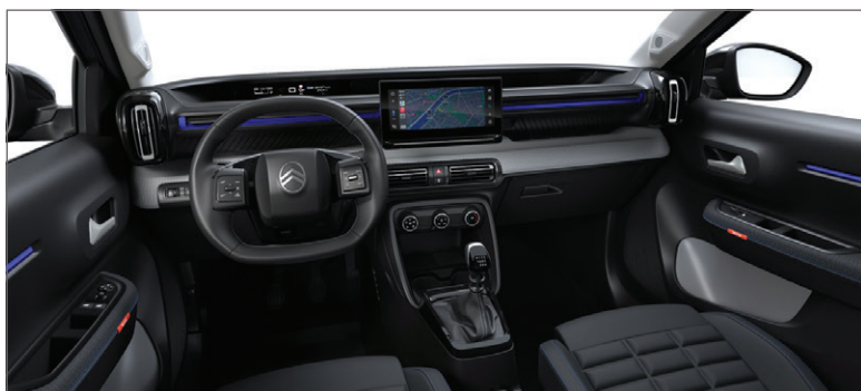
PLUS: LÁTKA ČERNÁ FABRIC / ŠEDÁ SERGE FABRIC