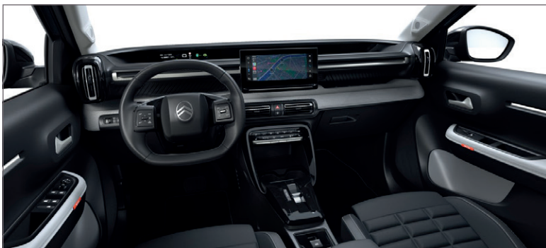
MAX: LÁTKA ČERNÁ FABRIC / ŠEDÁ KOŽENKA