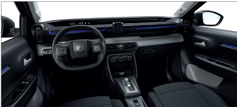
YOU: LÁTKA ČERNÁ FABRIC / ŠEDÁ FABRIC