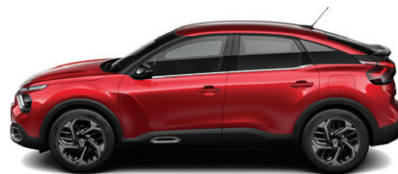
Červená ELIXIR (P*)