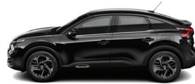
Černá OBSIDIEN (P)

N - Nemetický lak M - Metický lak P - Perletý lak P* - Perletý vícevrstvý lak