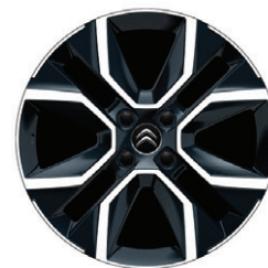
Hliníkový disk CROSSLIGHT 18" s výbrusem