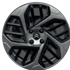
Hliníkový disk AEROBLADE 18"