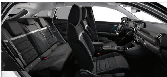
Mix Alcantara šedá / Látka s efektem černé kůže