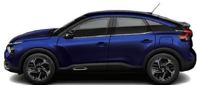
Modrá ECLIPSE (M)