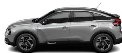
Šedá ARTENSE (M)