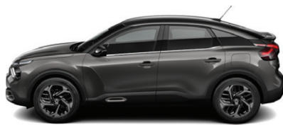
Šedá PLATINIUM (M)