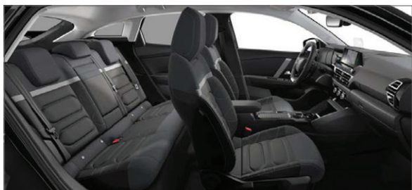
Mix Látka s efektem černé kůže / Látka šedá