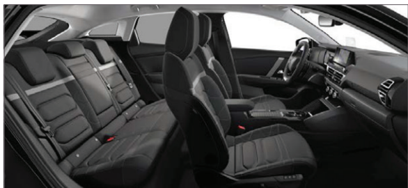
Mix Kůže Siena černá / Látka s efektem černé kůže