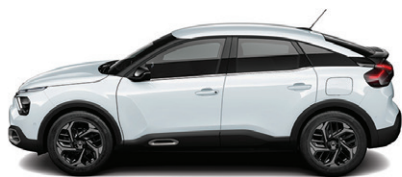
Bílá OKENITE (M)