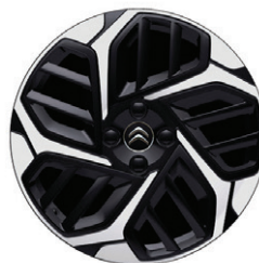
Hliníkový disk AEROBLADE 18" s výbrusem