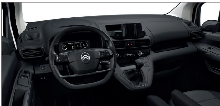
Interiér Látka Brasilia Černá - CMFY