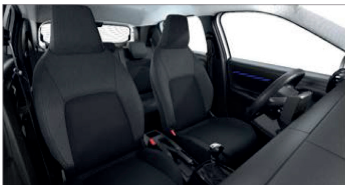
LÁTKA ČERNÁ FABRIC / ŠEDÁ FABRIC