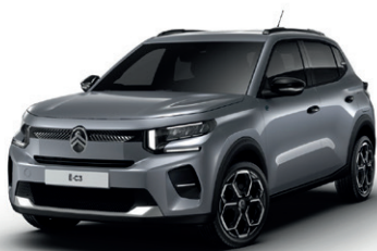
Šedá MERCURY (M)