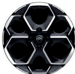
Hliníkový disk ATACAMITE 17" - diamantée