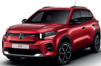
Červená ELIXIR (M)