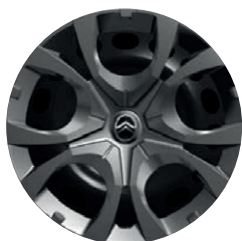
Okrasný kryt PYRITE 16"