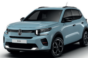
Modrá MONTE CARLO