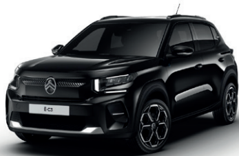
Černá PERLA NERA (M)