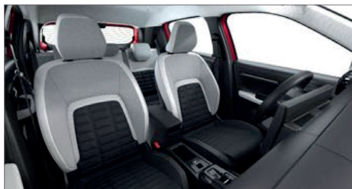
LÁTKA ČERNÁ FABRIC / ŠEDÁ KOŽENKA