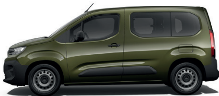
Zelená SIRKKA (K)