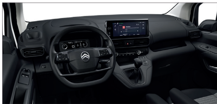
Interiér Látka LINE Šedá - OFFT