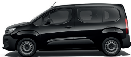
Černá PERLA NERA (M)