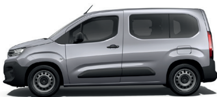
Šedá ARTENSE (M)