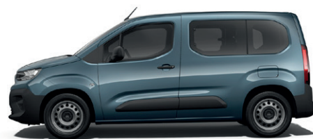
Modrá KIAMA (M)