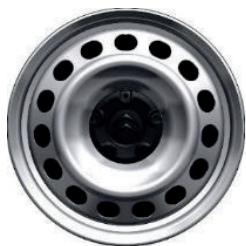
Kryt středu kol