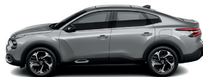
Šedá ARTENSE (M)