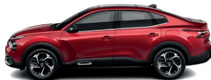
Červená ELIXIR (P*)