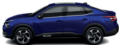
Modrá ECLIPSE (M)