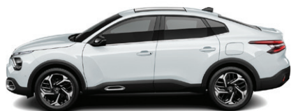
Bílá OKENITE (M)