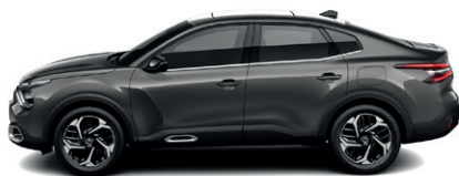
Šedá PLATINIUM (M)