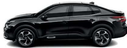
Černá PERLA NERA (P)

N – Nemetický lak; M – Metalický lak; P – Perleťový lak; P* – Perleťový vícevrstvý lak