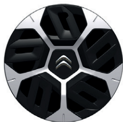
Okrasný kryt AEROTHECH 18"