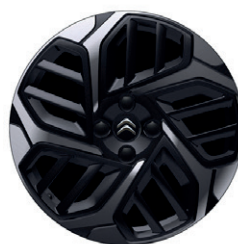
Hliníkový disk AEROBLADE 18"