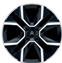
Hliníkový disk CROSSLIGHT 18" s výbrusem*