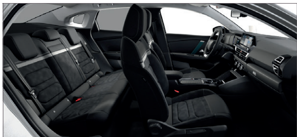
Mix Alcantara šedá / Látka s efektem černé kůže