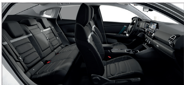
Mix Kůže Siena černá / Látka s efektem černé kůže