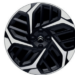
Hliníkový disk AEROBLADE 18" s výbrusem