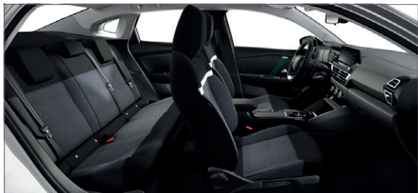
Mix Látka Meanwhile / Látka černá