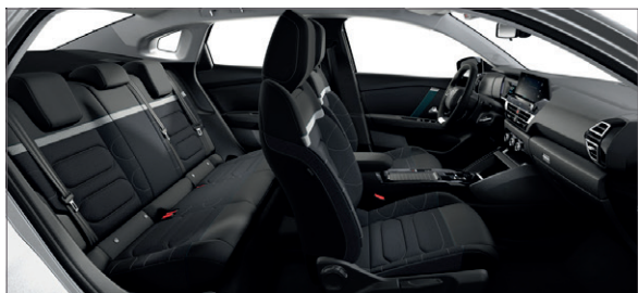
Mix Látka s efektem černé kůže / Látka šedá