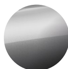
Metalická Šedá Volcanic Grey 15 000 Kč