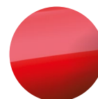
S. metalická Červená Sunrise Red 18 000 Kč