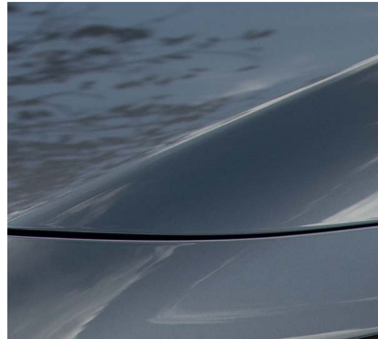
Šedá Machine Gray

Navštivte naše webové stránky a prohlédněte si všechny nádherné barvy, které jsou vám k dispozici.