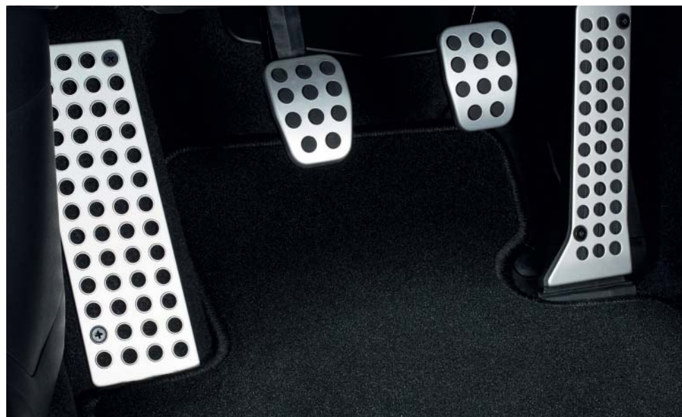
Sada sportovních pedálů