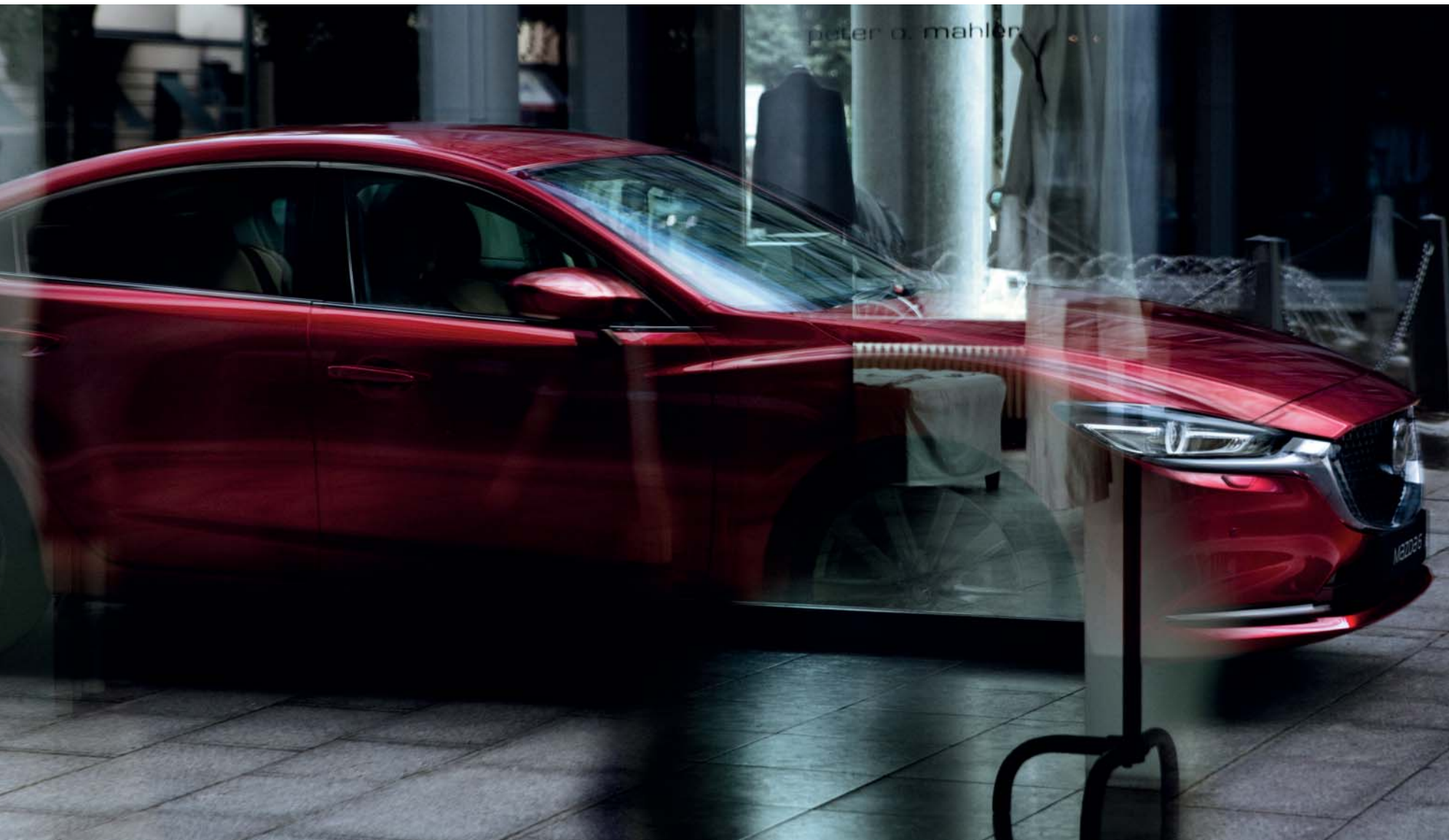
Tento obrázek ukazuje vůz Mazda6 Sedan ve výbavě Revolution v červené barvě Soul Red Crystal.