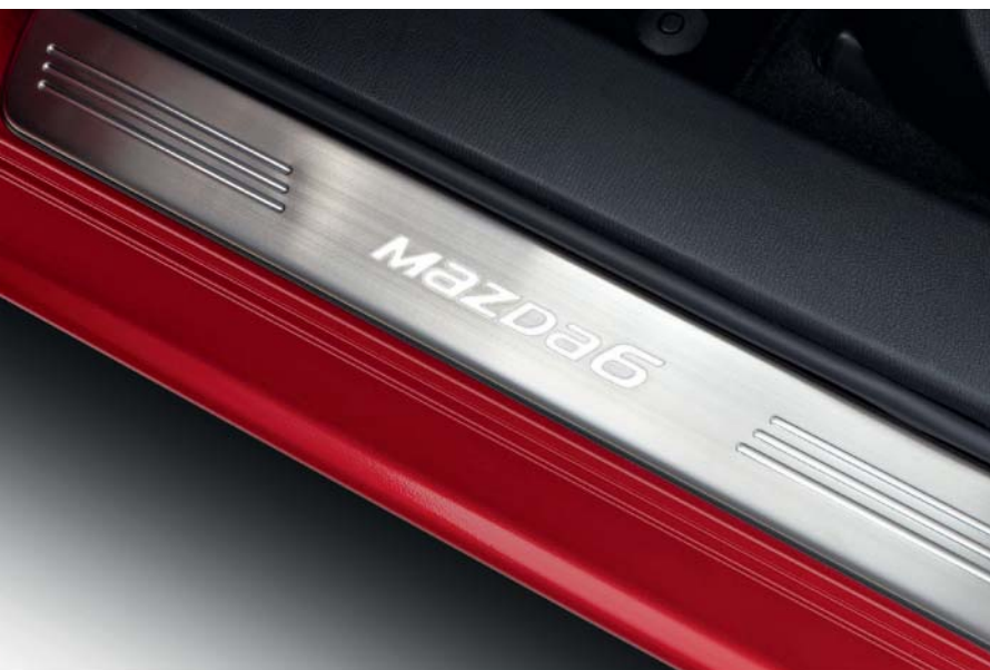
Osvětlené lišty prahů

Společnost Mazda vytvořila důmyslná příslušenství, která se perfektně hodí k vaší Mazdě6. Máte-li zájem o kompletní seznam originálních příslušenství Mazda pro vaši Mazdu6, navštivte naše webové stránky.