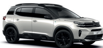
Bílá PERLE NACRE