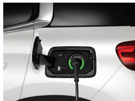
Zásuvka pro nabíjení umístěná symetricky s víčkem nádrže