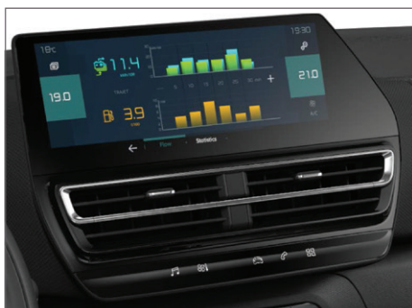
Speciální obrazovky dotykového displeje umožňující nastavení nebo konzultaci hybridního režimu