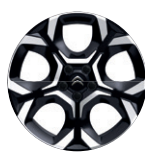
18" hliníkový disk PULSAR