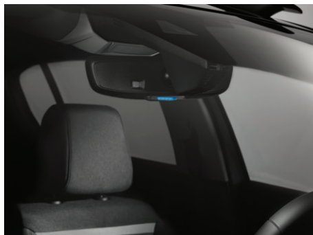
LED kontrolka signalizuje jízdu v elektrickém režimu