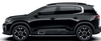
Černá PERLA NERA