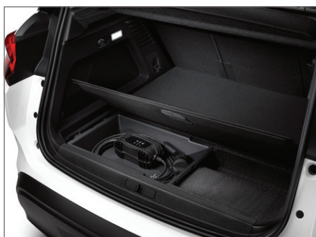
Speciální úložný prostor pro nabíjecí kabel