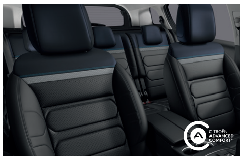
Interiér HYPE Černý