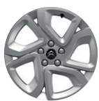
17" hliníkový disk ELLIPSE