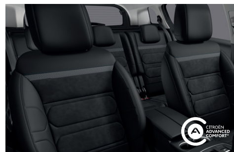
Interiér URBAN Černý