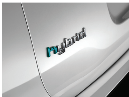
Monogramy HYBRID na karoserii