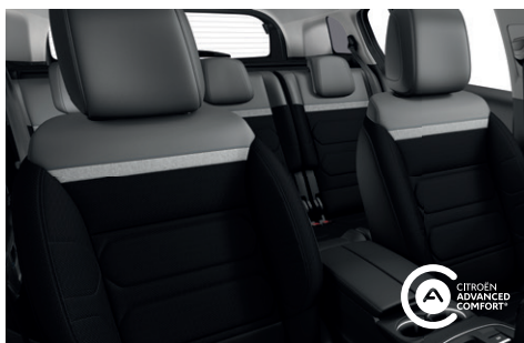
Interiér WILD Černý