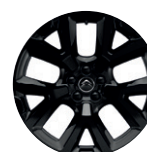
19" hliníkový disk ART ČERNÉ