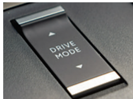
Ovládací tlačítko umožňující zvolit režim jízdy (ELEKTICKÝ, HYBRIDNÍ, SPORTOVNÍ)