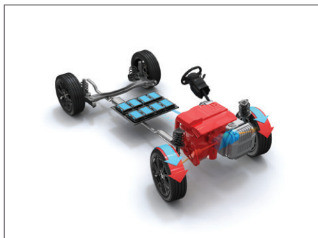
Hybridní pohon s dojezdem až 50 km v elektrickém režimu