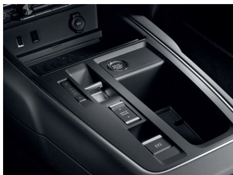
Převodovka 8-EAT s režimem « BRAKE », pro účinnější dobíjení