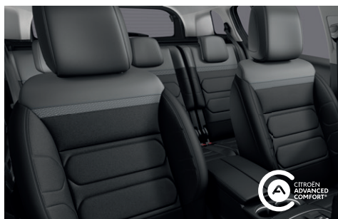
Interiér METROPOLITAN Černý