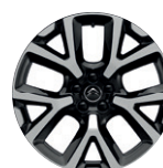
19" hliníkový disk ART