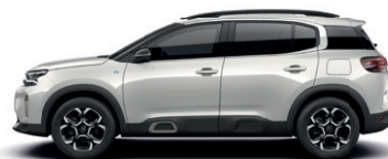
Bílá PERLE NACRE