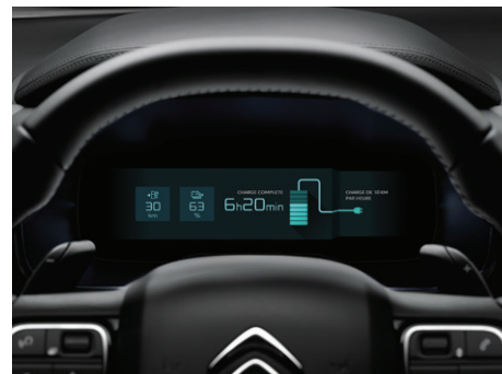
Digitální přístrojový 12,3", displej se zobrazením hybridního režimu