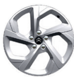
18" hliníkový disk SWIRL