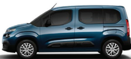
Modrá DEEP (M)