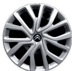
Okrasný kryt TWIRL R16 - černý střed