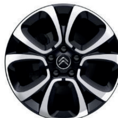
Hliníkový disk SPIN R17