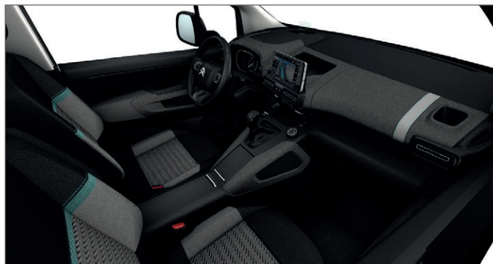
Sériový interiér pro FEEL, FEEL PACK, SHINE OFFT - Látka LINE Šedá včetně příplatkové opce ER38 - Panely dveří Metropolitan šedé. - středová konzola není součástí interiéru