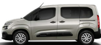
Běžová SABLE (M)