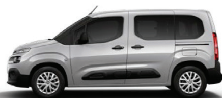
Šedá ARTENSE (M)