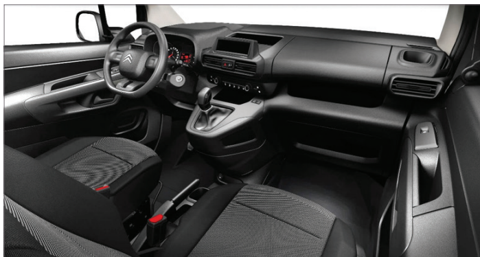
Sériový interiér pro LIVE PACK OAFY - Látka MICA Šedá