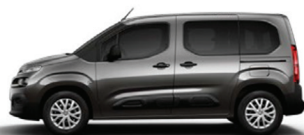
Šedá PLATINIUM (M)