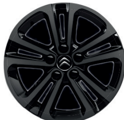
Hliníkový disk (celo-černý) STARLIT R16