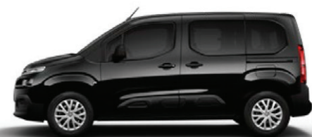
Černá PERLA NERA (M)