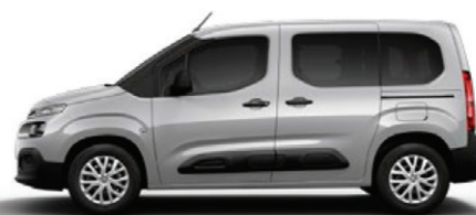
Šedá ARTENSE (M)