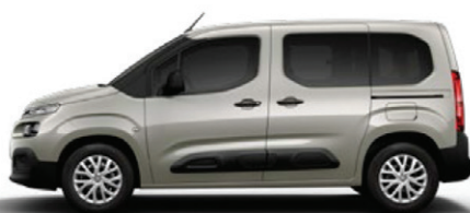
Běžová SABLE (M)