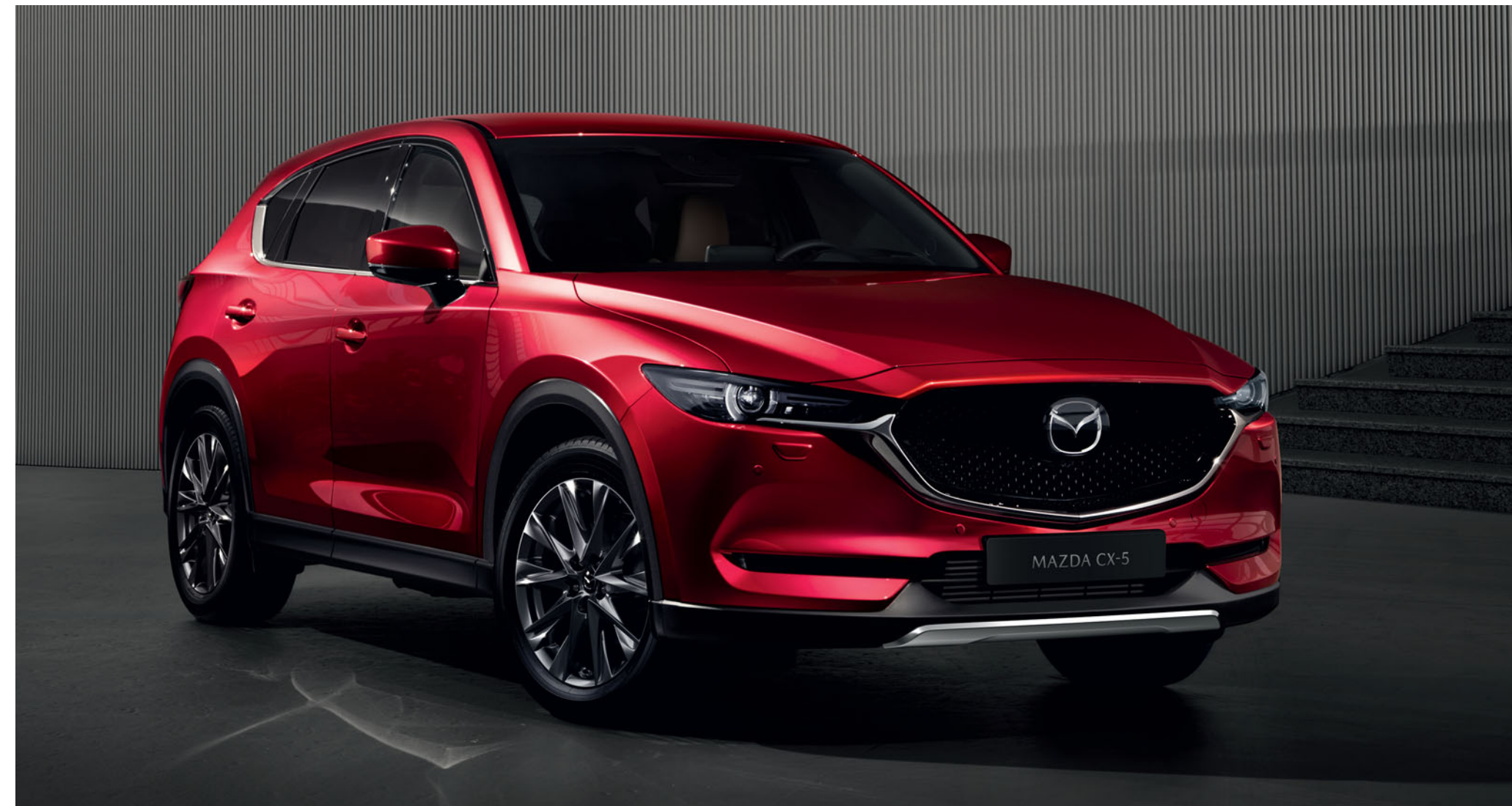
Přední ozdobní kryt