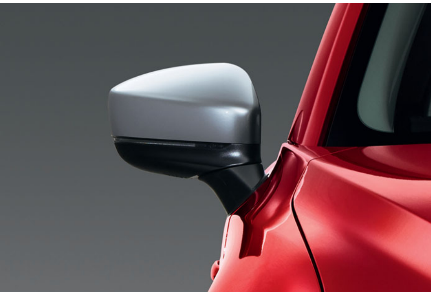
Stříbrná krytka vnějšího zpětného zrcátka

Užitnou hodnotu vaší Mazdy CX-5 dále zvýší propracované originální příslušenství.