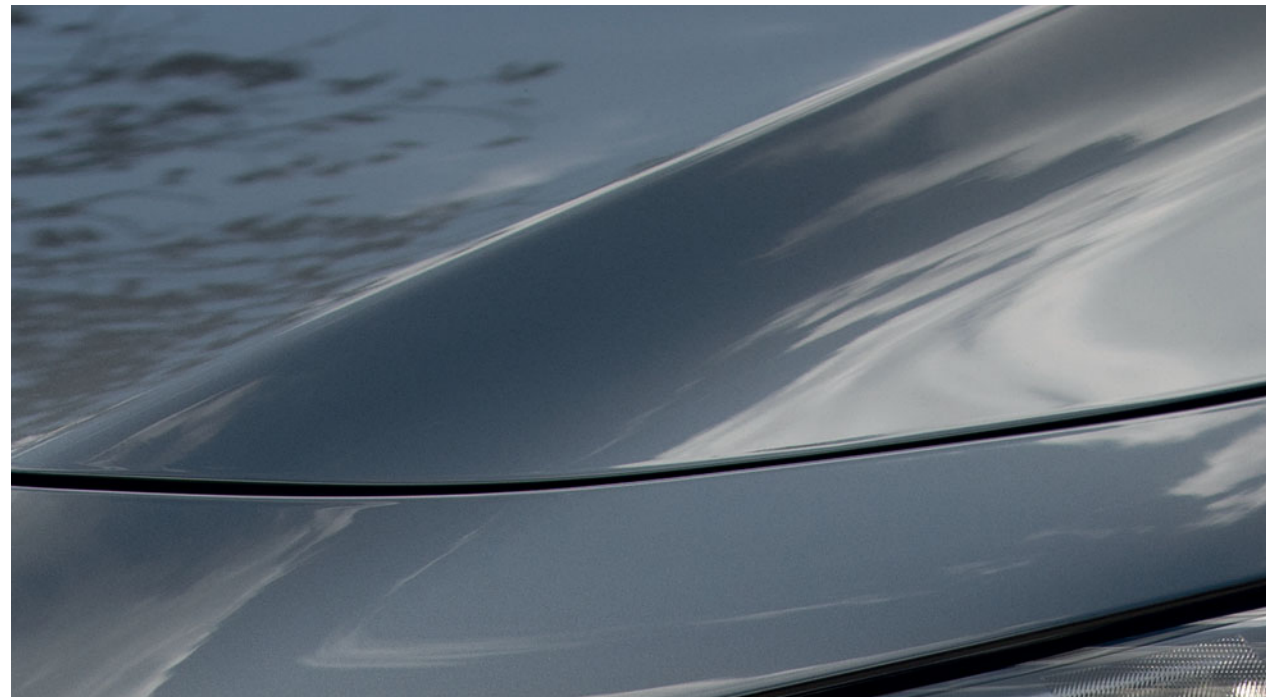
Šedá Machine Gray

Navštivte naše internetové stránky a prohlédněte si všechny dostupné úžasné barevné varianty.