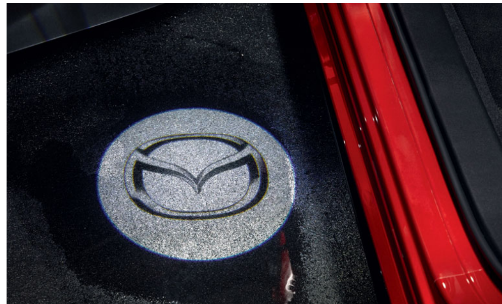
LED osvětlení vozovky s logem Mazda