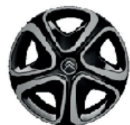
Okrasný kryt Steel & Style 3D 16"