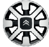
Hliníkový disk CROSS 17"