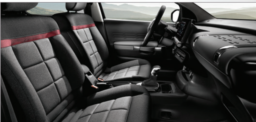
Látka Sílica šedá / C-SERIES