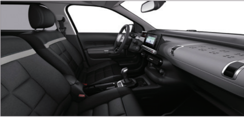
Látka Sílica šedá / WILD GREY