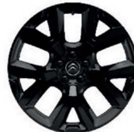
Hliníkový disk ART ČERNÉ R19