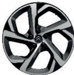
Hliníkový disk SWIRL DIAMANTÉE R18