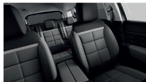
Mix Kůže GRAINE Grafitová - Látka Grafitová / METROPOLITAN Šedý (sériový pro SHINE)