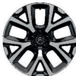
Hliníkový disk ART DIAMANTÉE R19