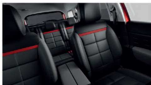
Látka STONE Šedá / WILD Šedý