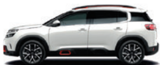
Bílá PERLE NACRE