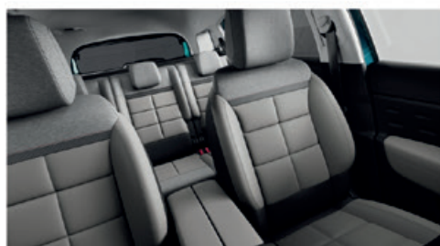
Mix Kůže GRAINE Šedá - Látka Šedá / METROPOLITAN Běžový