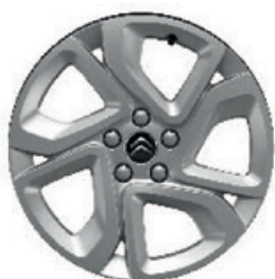
Hliníkový disk ELLIPSE R17