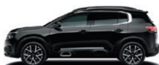
Černá PERLA NERA