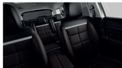
Mix Kůže NAPPA Hnědá - Látka Hnědá / Hype Hnědá