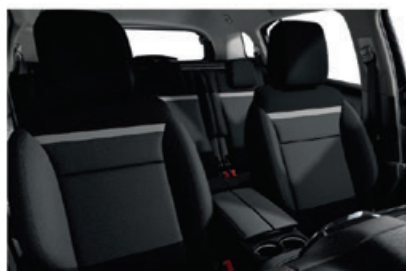
Látka SILICA Šedá (sériový pro LIVE s FEEL)