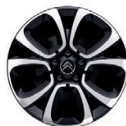
Hliníkový disk SPIN R17