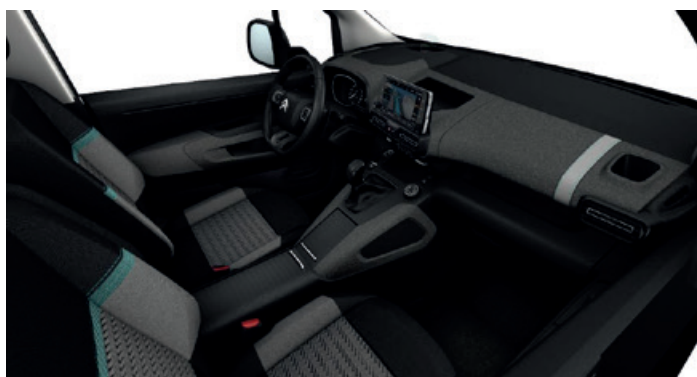
Příplatkový interiér OFFT - Látky LINE Šedá / Metropolitan - středová konzola CU26 je samostatná příplatková výbava