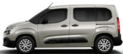
Běžová SABLE (M)