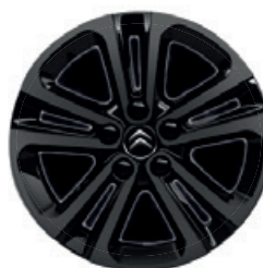
Hliníkový disk (celo-černý) STARLIT R16