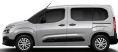
Šedá ARTENSE (M)