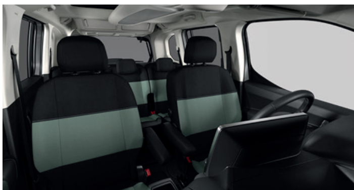
Sériový interiér OEFG - Látky MICA Zelená