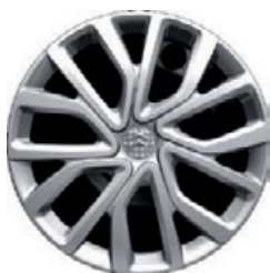
Okrasný kryt TWIRL R16