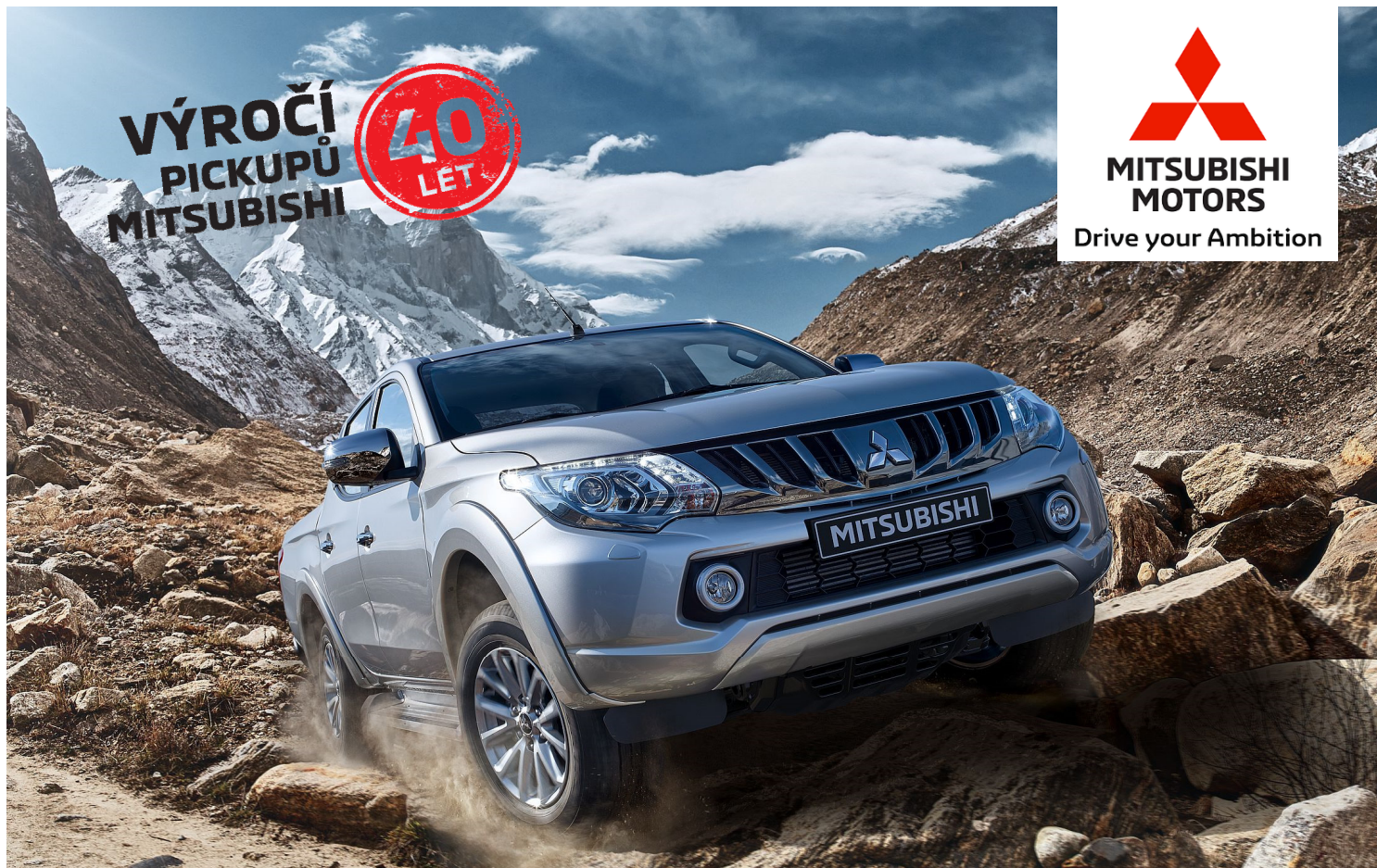
MITSUBISHI L200 DOUBLE CAB (MY19)